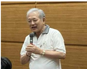
安藤副理事長（市民社会創造ファンド）