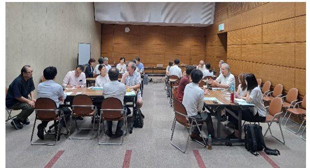
第2部 グループ交流

参加者のアンケートからは、「担当年数でグループ分けされており話しやすかった」「地域や分野別の話があり、より多角的に検討できた」「新たな視点での意見を聞け、考え方や視野が広がった」「今後の連携の兆しも見つけられた」という声もありました。